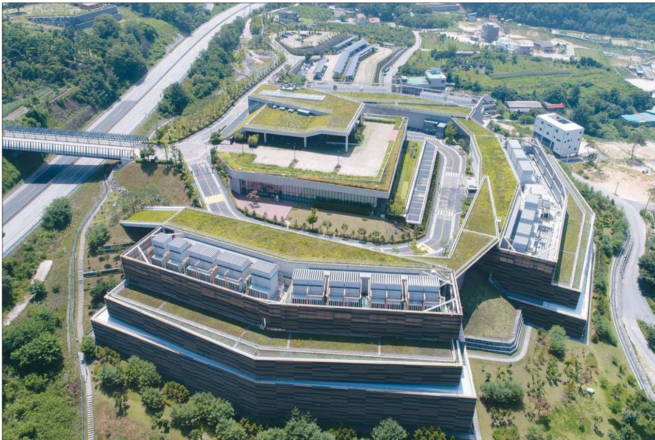
네이버 강원도 춘천 데이터센터 전경.