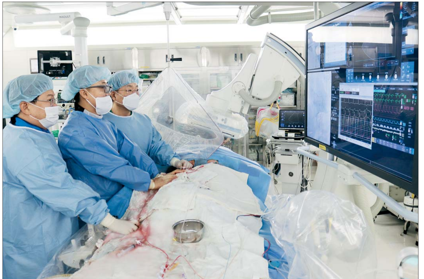
서울아산병원은 2021년 5월 아시아 최초로 경피적 대동맥 판막 치환술 1000례를 달성했다.