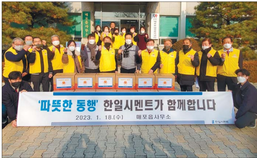
따뜻한 동행 한일시멘트가 함께합니다 2023. 1. 18.(수) 매포읍사무소