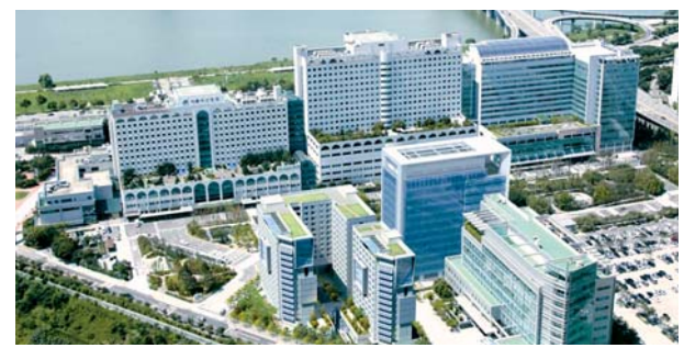
표 저개발국 의료자립 도와