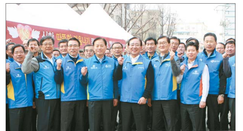
신한 따뜻한 겨울나기 쪽방촌 나눔

맞아 신한은 ‘따뜻한 금융’의 버전 2.0인 ‘미래를 함께하는 따뜻한 금융’을 통해 고객과 사회로부터 신뢰를 높여 나간다는 목표를 세운 바 있다. 신한금융은 리스크 관리 역량과 은행과 비은행 부문의 균형적인 수익 창출 기반을 바탕으로 2010년 국내 금융그룹 처음으로 당기 순이익 2조원을 달성했고, 2011년에는 3조원 클럽에 가입하는 등 6